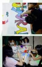
> TALLER DE EXPRESIÓN PLÁSTICA PARA NIÑOS