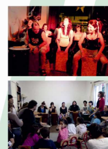
> TALLER DE PERCUSIÓN