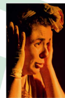
> TALLER DE TEATRO